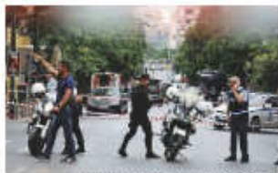
COEN, FELTRI E ZUNINI A PAG. 6-7