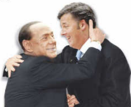
Alleanza Silvio Berlusconi e Matteo Renzi

■ Telefonata tra i prossimi alleati che studiano un faccia a faccia. Berlusconi: "Alle elezioni non sbaglio mai". E aizza gli imprenditori contro il M5S, fatto passare per "nuovi comunisti". Voucher, Mdp minaccia: "Ci sfiliamo"