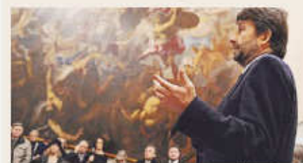
Figure internazionali Il ministro Dario Franceschini.

Il Tar umilia Franceschini Tutto da rifare per i musei